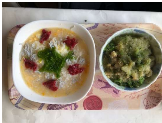
大根、生姜、きゅうりおろし。