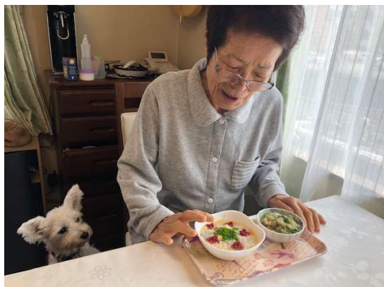
梅干し、アオサ、しらす、たまご雑炊。

食事は私が担当。漢方医学に基づいた＜薬膳＞の知識を活かして 仕事の合間に3食つくりました。 入院2日目（食事開始）。