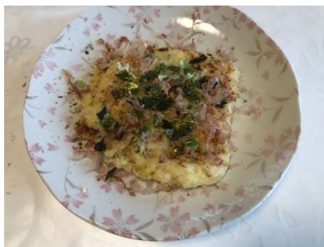
山芋の＜薬膳＞お好み焼き