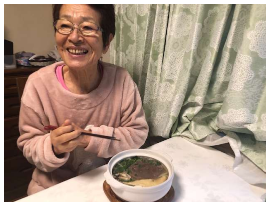
牡蠣と牛肉の鍋焼きうどん

平熱になり、回復傾向が見えたところで、＜タンパク質＞を盛り込んだ献立にします。最初から栄養価の高い食事を摂ると、逆に治りが遅くなります。母曰く、2日目の雑炊が一番美味しかったそう。😊